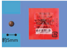
【安定ヨウ素剤】

A: 安定ヨウ素剤は、医療用の医薬品です。原子力発電所の事故の際、放射性ヨウ素による甲状腺の内部被ばくを抑える効果があります。特に成長期にある子どもや若年層の服用が必要とされ、40歳以上の人には甲状腺がんのリスクは少ないと言われています。