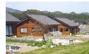
篠山市大山荘の里市民農園

見知らぬ土地に移住するのは色々不安が伴います。まずは、体験施設で篠山暮らしを体験してみたいか、イメージだけで田舎にやってくる後悔をしないようにゆっくりと篠山暮らしのステップをすすめてください。