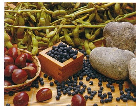
篠山の特産物(丹波黒大豆、山の芋、丹波栗)

篠山を語るには、丹波黒大豆、山の芋、栗、松茸、ぼたん鍋など篠山の大地の恵みである特産物とその食文化を抜きにできません。それぞれのシーズンには篠山の「食」を求めて多くの観光客が訪れるなど、「丹波篠山の農産物」として全国ブランドの地位を確立しています。