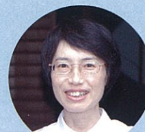
森田さんご夫妻とお子様(小学生) 〔加東市から移住〕