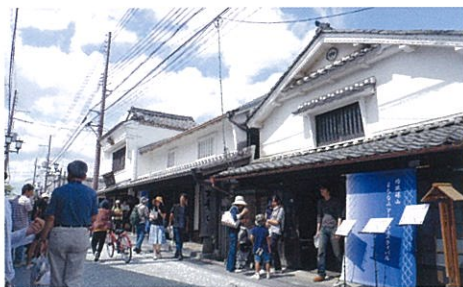
河原町妻入商家群

篠山は周囲を山に囲まれた盆地の中に、城下町の雰囲気や今に伝える歴史的な町並みが残っています。平成16年には「重要伝統的建造物群保存地区」に選定され、その町並みは全国的にも高く評価されています。最近では、古い町屋を活かしたカフェや雑貨店など新しいお店も増えてきています。情緒あふれる城下町を歩きながら、篠山の歴史・文化、そしてお買い物を楽しんでください。