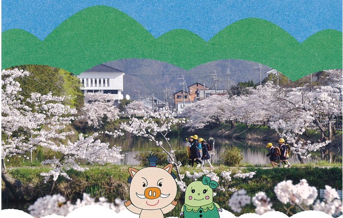
篠山市マスコット キャラクター まるいの