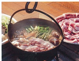
丹波篠山名物 ぼたん鍋

盆地特有の気候、澄んだ空気と水、そこに住む住民の生活、その全てが相まって篠山ではたくさんの美味しいものがあります。多くの飲食店でも特産品を活かした料理がふるまわれ、また最近では新たな篠山の名物を生み出そうとする動きもみられます。一度食べたら忘れられない、丹波篠山のうまいもんを是非ご堪能ください。