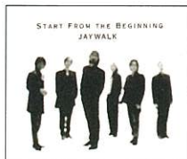
New Maxi Single START FROM THE BEGINNING MECR-12105