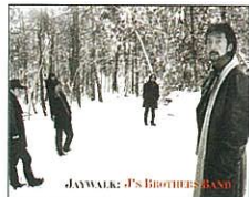
New Album J's BROTHERS BAND MECR-30115